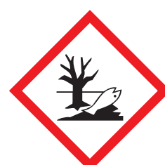
Schadelijk voor het milieu