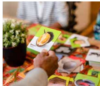
Memory sluit aan bij eigen cultuur