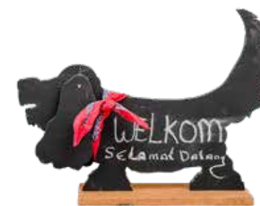
Toegangsbordje op de afdeling