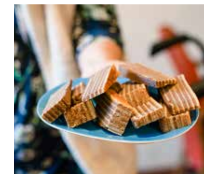
Vandaag wordt spekkeok uitgedeeld