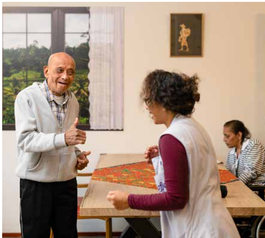
Spontaan dansje in de huiskamer